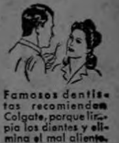
Famosos dentistas recomiendan Colgate, porque limpia los dientes y elimina el mal aliento.

Si, esos dulces y ansiados besos podrán traerle eterna felicidad. Pero la ilusión del beso puede ser destruida por el MAL ALIENTO. Recuerde que de 10 personas, 7 tienen mal aliento sin saberlo. No se arriesgue usted. Use Crema Dental Colgate. Su penetrante espuma llega hasta los intersticios de los dientes y desaloja los microbios y residuos de comida que generalmente causan el mal aliento, los dientes manchados, las encías flojas y la destructora caries. Colgate deja los dientes completamente limpios, las encías sanas y el aliento perfumado.