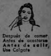
Después de comer. Antes de acostarse. Use Colgate.